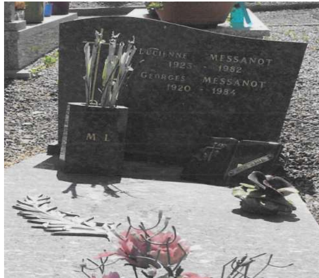
Tombe de Georges et Lucienne Messanot au cimetière Saint-Etienne de Fréjus

Le 21 août 1996, le conseil municipal de Saint-Pierre décidait que la rue du lotissement Briand qui prenait naissance rue Georges Landry et se terminait à la parcelle 200 (aujourd'hui rue Pierre Perrin) porterait le nom de rue Georges Messanot.