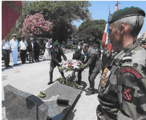
Cérémonie du 18 juin 2018 au cimetière Saint-Etienne de Fréjus